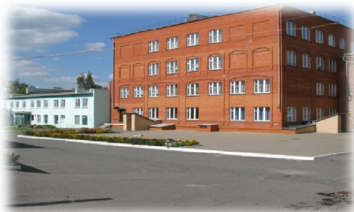
МБОУ «СОШ № 1 с УИОП имени Княжны Ольги Николаевны Романовой»