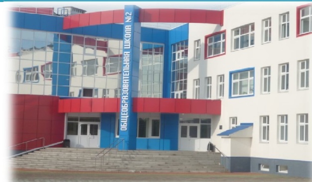
МБОУ «СОШ № 2 с УИОП»

муниципальный центр по подготовке к всероссийской олимпиаде школьников для учащихся общеобразовательных учреждений района на базе 4-х школ города