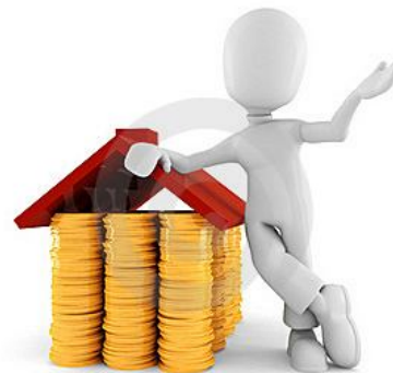
Создание банков данных