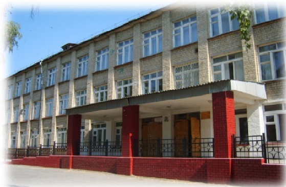
МБОУ «СОШ № 3»

муниципальный центр по подготовке к всероссийской олимпиаде школьников для учащихся общеобразовательных учреждений района на базе 4-х школ города