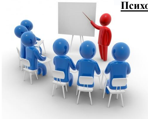
Повышение квалификации учителей