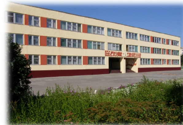
МБОУ «СОШ № 4»