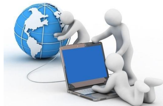
Дистанционная подготовка к олимпиадам через участие в различных предметных конкурсах и дистанционных олимпиадах

СОЗДАНИЕ ЕДИНОЙ СИСТЕМЫ ПОДГОТОВКИ УЧАЩИХСЯ К УЧАСТИЮ ВО ВСЕРОССИЙСКОЙ ОЛИМПИАДЕ ШКОЛЬНИКОВ